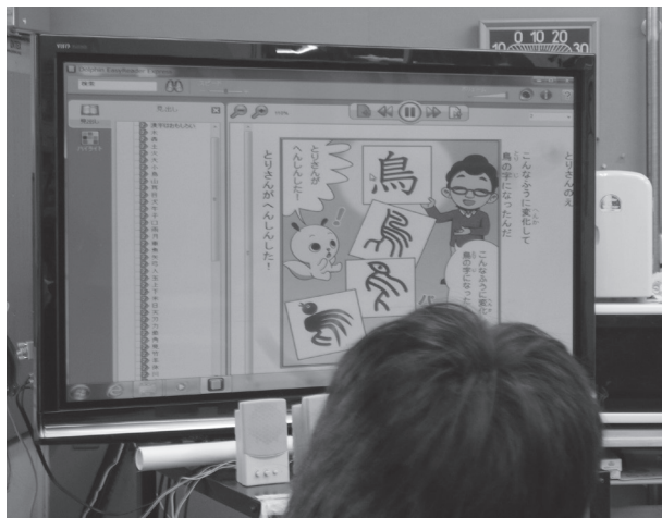
高等部 国語 授業の様子

教室のパソコンから50インチの大きなテレビに映して利用しました。隣にホワイトボードと手元には、本で使われている漢字の中からいくつかの