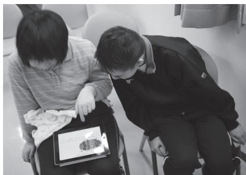
はらぺこあおむしを二人で読む