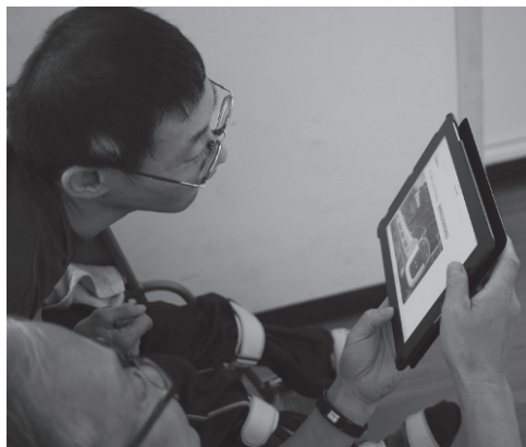
わいわい文庫を見る

が、時々 iPad から流れてくる声に唱和するように声を出していた。このようにマルチメディアDAISYにはことばを誘発する力があるようだ。どの方もとても集中して楽しんでくださったと思う。