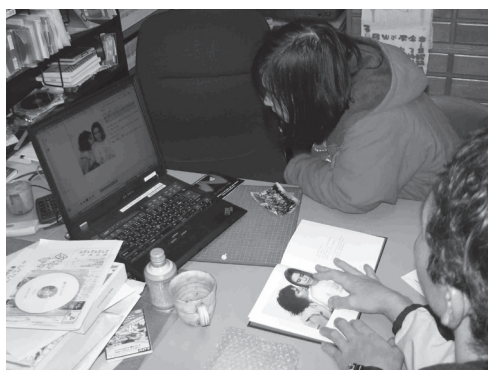
『赤いハイヒール』を声を出して読む

今までマルチメディアDAISY図書は、ディスレクシアをはじめ学習障害や知的障害の方に有効と言われてきたが、何と発語されているか聞き取りにくい難聴の方にもとても有効であることがわかったのだった。