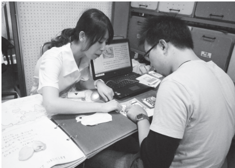
「わいわい福祉フェスタ」での説明の様子

新宿区立障害者福祉センターと協働し、地域福祉の推進を目的とした「わいわい福祉フェスタ」にこれまで5回参加しています。マルチメディアDAISY図書の体験会を実施し、身体障害、知的障害、発達障害者だけでなく子どもたちにも紹介する機会となっています。