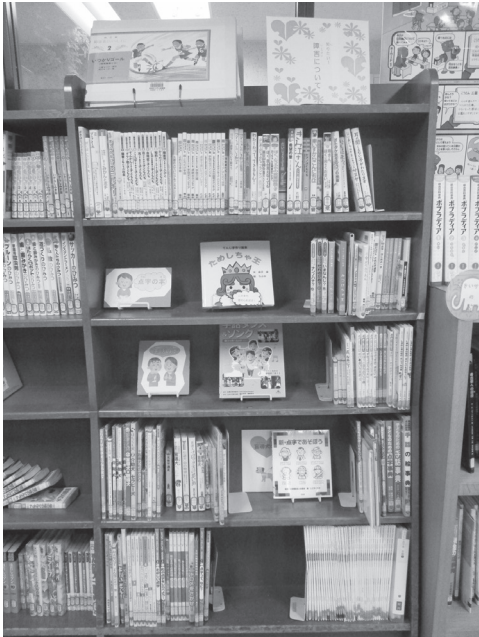
児童室の点字や手話の本

戸山図書館では、2015年にタブレット型端末を導入し、誰もが手軽にマルチメディアDAISY図書を読覧できるようにしました。