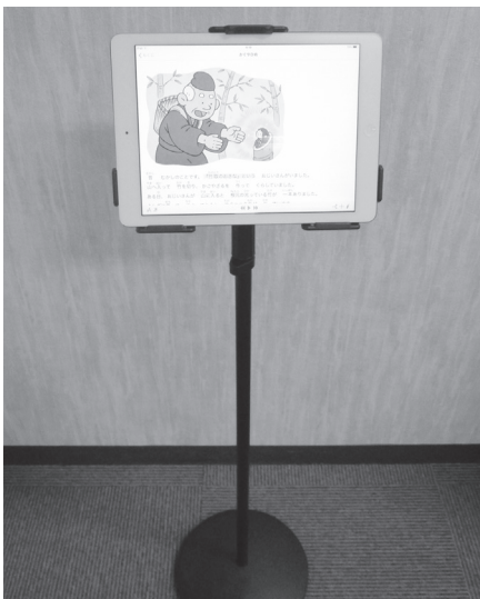
iPadでのマルチメディアDAISY図書の閲覧

戸山図書館では、2015年にタブレット型端末を導入し、誰もが手軽にマルチメディアDAISY図書を読覧できるようにしました。