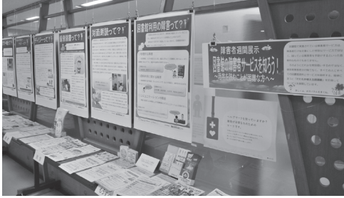
12月の障害者週間企画展示 「図書館の障害者サービスを知ろう！ ～活字を読むことが困難な人へ～」