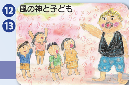
新潟県燕市 標準語(7分) 方言(7分)