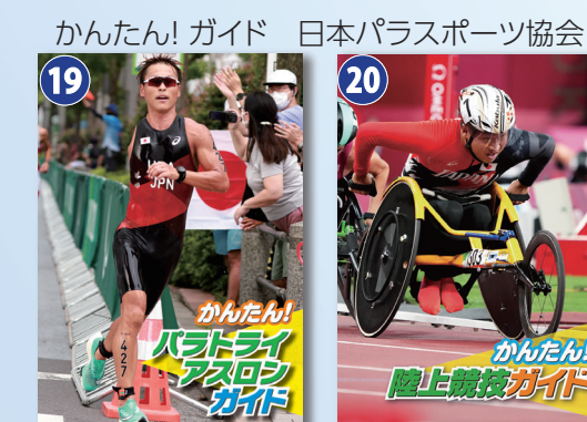
パラトライアスロン (26分)