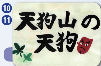
栃木県下野市 標準語(4分) 方言(3分)