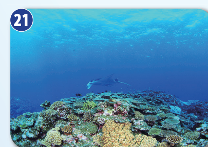
海中をのぞいてみよう9 (15分)