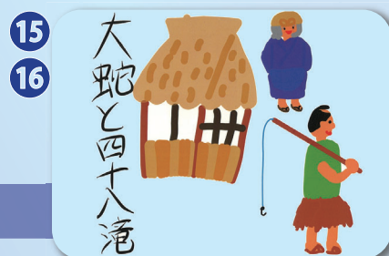
岐阜県高山市 標準語(7分) 方言(7分)