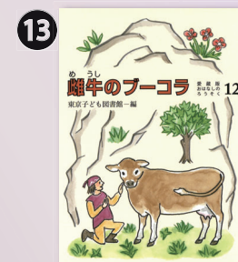
東京子ども図書館 『雌牛のブーコーラ』(10分)