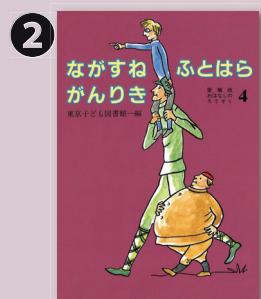
東京子ども図書館 『おばあさんとブタ』(12分)