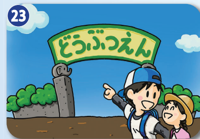
マゼマゼどうぶつえん (4分)