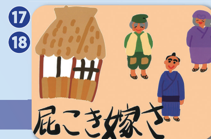
岐阜県高山市 標準語(6分) 方言(5分)