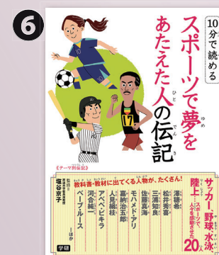
学研プラス (3時間7分)