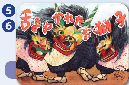
東京都稲城市 標準語(5分) 方言(5分)