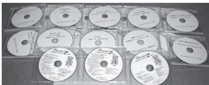
横浜市立盲特別支援学校にて 分割したCD