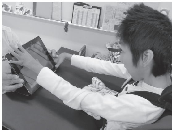
学校での活用風景（休み時間）

また中途障害の生徒の保護者からは、障害が生じる以前は英語圏で生活していたので、英語の話のほうが反応が良いとのことでした。