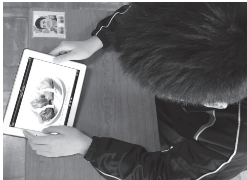
休み時間に教室で

聞こえてくる音とともに少しずつ現れるお菓子の様子をよく見ていました。知っている“プリン”などのページは、視線をそらすことなく見ることができました。聞こえてくる言葉とイラストをつなげて楽しんでいる様子が見られました。この教材を通して、今まで知らなかったお菓子も知ることができました。