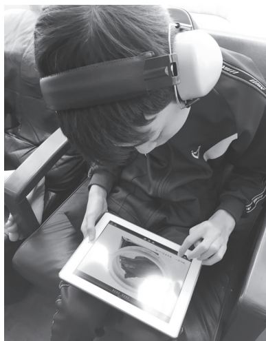
文字部分をさわって

音声とともに文字の色が移っていくところに注目し、指で触っていました。触っても反応がないことがわかると、イラストのほうに集中し、ページに出てくるお菓子に注目していました。発音しやすい“プリン”や“クッキー”などは音声を聞いてからの促しで「ぷ・り・ん」と発音することもできました。「おいしそうですね～」の言葉かけにより、より目を見開いて画面を見ている姿が見られました。